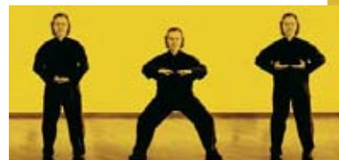
© AWF-art aus der Serie „Die Kunst des Stehens“ Serie A, B, C, D, E und Ä

Andreas W Friedrich Institut Integrales Tai Ji Quan & Qi Gong Sendlinger Straße 21 80331 München Postanschrift Geyerspergerstraße 25 80689 München Tel 089 / 89 89 10-40 Fax -50 Bankverbindung HypoVereinsbank Andreas W Friedrich Konto 43 123 700 BLZ 700 202 70 IBAN DE12 7002 0270 0043 1237 00 SWIFT HYVEDEMMXXX Steuer-Nr.: 147/121/50034 info@awf-taiji.de www.awf-taiji.de www.awf-art.de